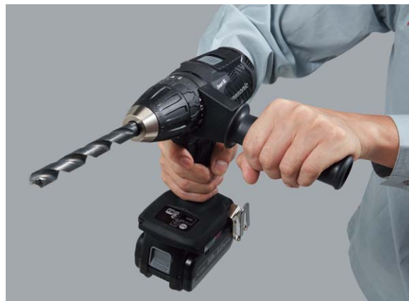
補助ハンドル(別売)が装着でき 穴あけ作業がラク