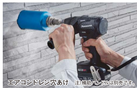
エアコンドレン穴あけ 注) 補助ハンドルは別売です。