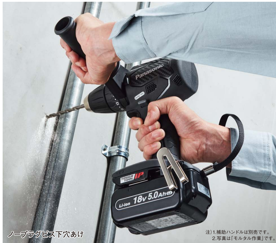
ノープラグビス下穴あけ