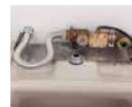
③ 既設の部品(電磁弁、発電機等)を撤去し、専用部品で封水処理