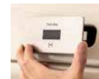
⑤ センサーユニットを取り付け、完成