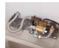
④ 専用の電磁弁ユニットを取り付ける