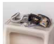
② 小便器の蓋を取り外した状態