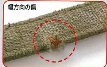
※写真は実際に屋内工場で使用されていたキトーベルトスリングで、破損時のイメージです。