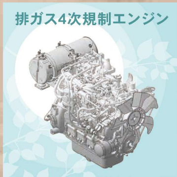
排ガス4次規制エンジン