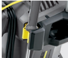
ランス固定ホルダー