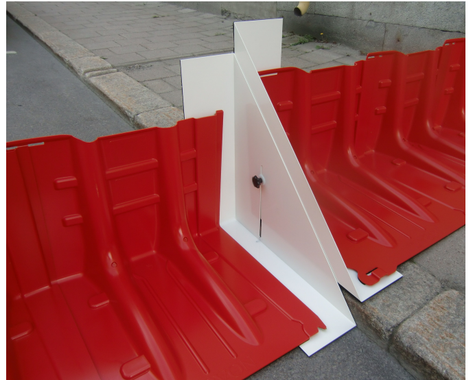
サイド・アタッチメント/段差対応