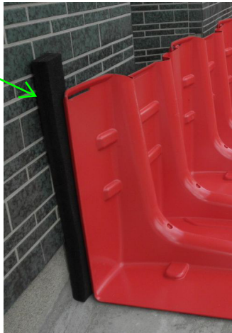
シーリングストリップ