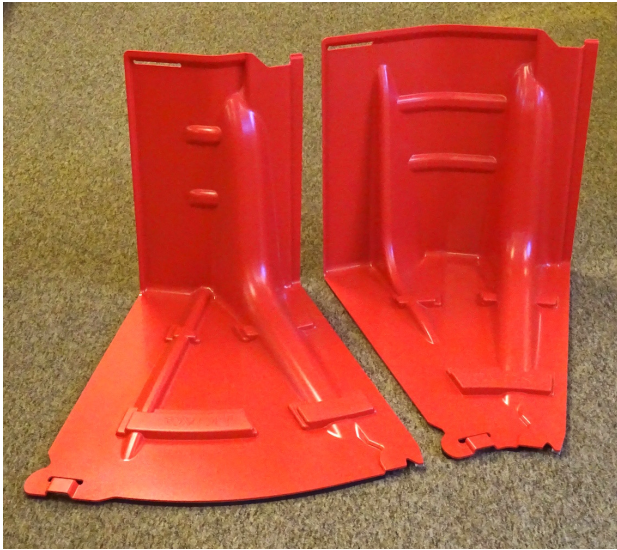
コーナー材：OUT型 コーナー材：IN型